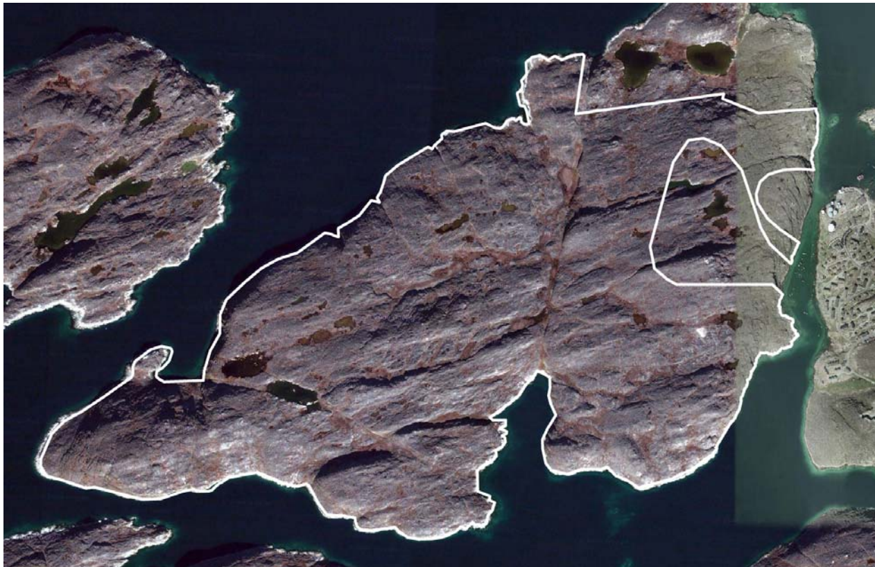
Imm. ilaa B20 | Delområde B20

for en løsning, hvor der anlægges en ny dæmning/bro over sundet fra Tupilakøen til Aasiaat.